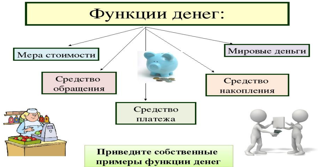
Рисунок 2. Функции денег

Сущность денег как экономической категории проявляется в их функциях, которые выражают внутреннюю основу содержания денег. Деньги выполняют следующие пять функций (Рисунок 2):