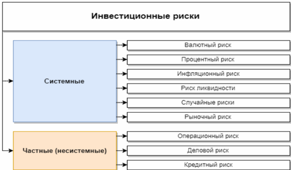
Рисунок 3. Инвестиционные риски

Отсюда вытекает важнейшая цель любого инвестирования, которая заключается не только в сохранении, но и в постоянном увеличении капитала. Удачные инвестиции позволяют рассчитывать на то, что в конечном итоге можно добиться главной цели любого здравомыслящего человека, которая заключается в минимальном расходовании времени на зарабатывание средств.