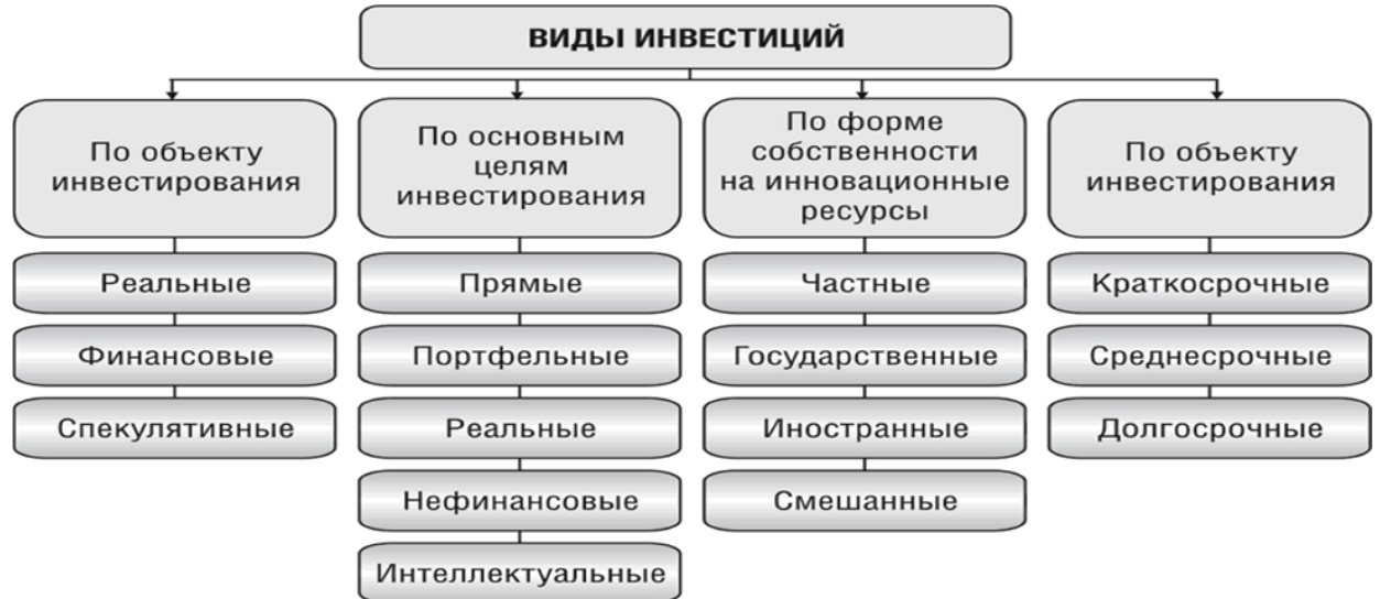
Рисунок 1. Виды инвестиций

инвестиционный проект (одна форма инвестиций); инвестиционный портфель (различные формы инвестиций одного инвестора) (Рисунок 1).