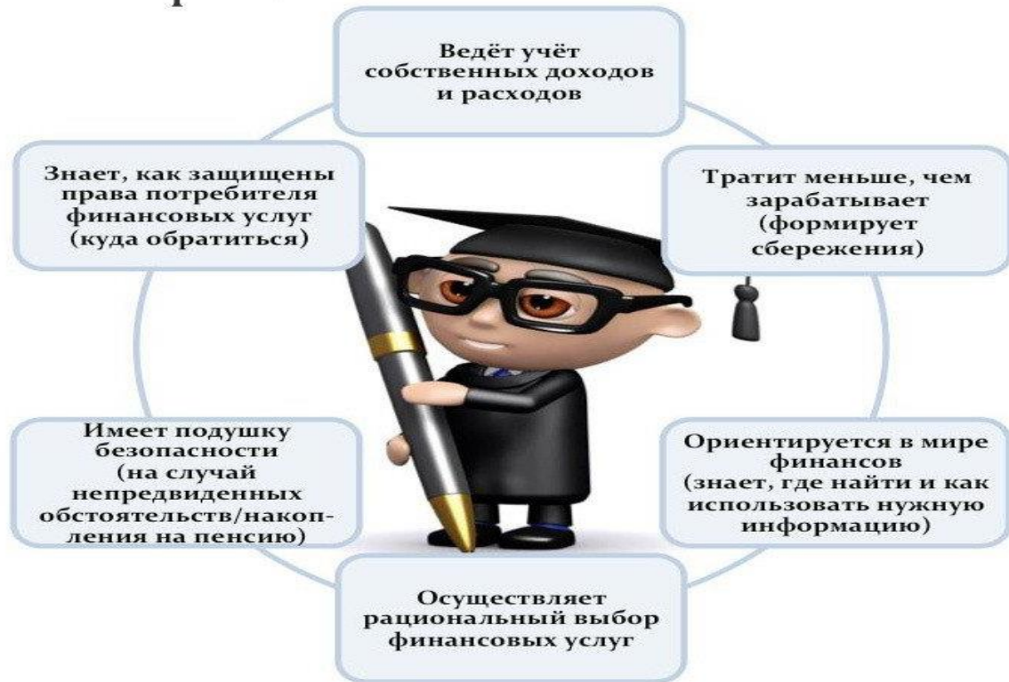
Рисунок 1. Образ финансово грамотного человека