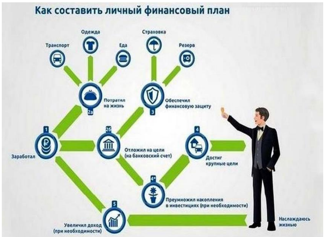
Рисунок 1. Как составить свой финансовый план

Таким образом, личный финансовый план – это финансовый инструмент, помогающий анализировать и оптимизировать денежные потоки, в которых мы находимся на протяжении всей жизни. А это позволяет, в свою очередь, разработать механизм достижения поставленных целей, увидеть всю финансовую картину целиком на несколько лет вперед.