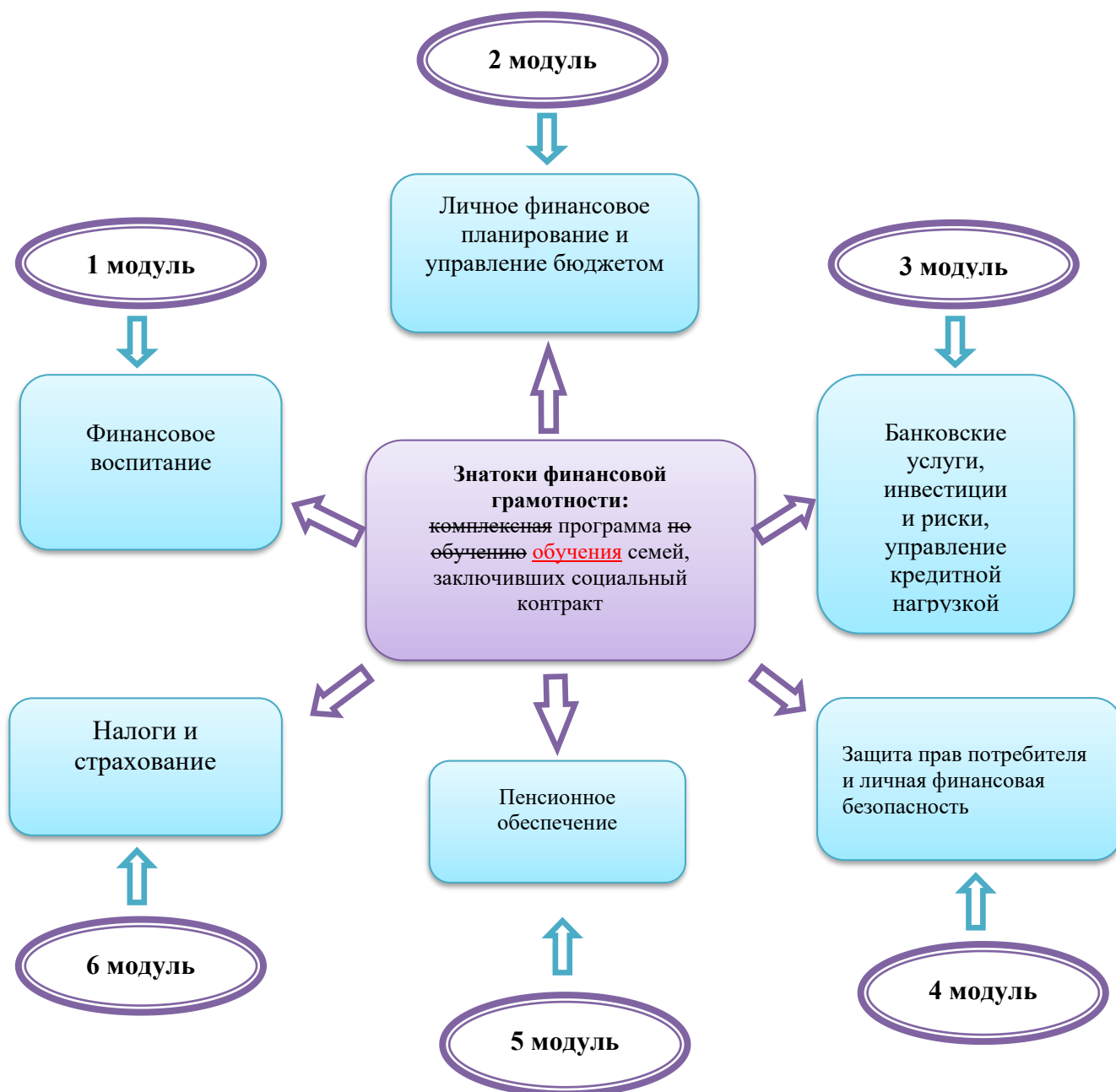
Рисунок 1. Направления комплексной программы по обучению семей, заключивших социальный контракт.

1. Финансовое воспитание – целью изучения является развитие экономического образа мышления, воспитание ответственности и нравственного поведения в области экономических отношений в семье, формирование опыта применения полученных знаний и умений для решения элементарных вопросов в области экономики семьи.