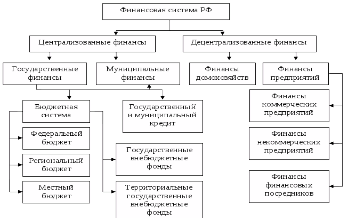
Рисунок 4. Финансовая система РФ

Финансовая система – совокупность различных сфер финансовых отношений, в процессе которых образуются и используются фонды денежных средств (Рисунок 4).