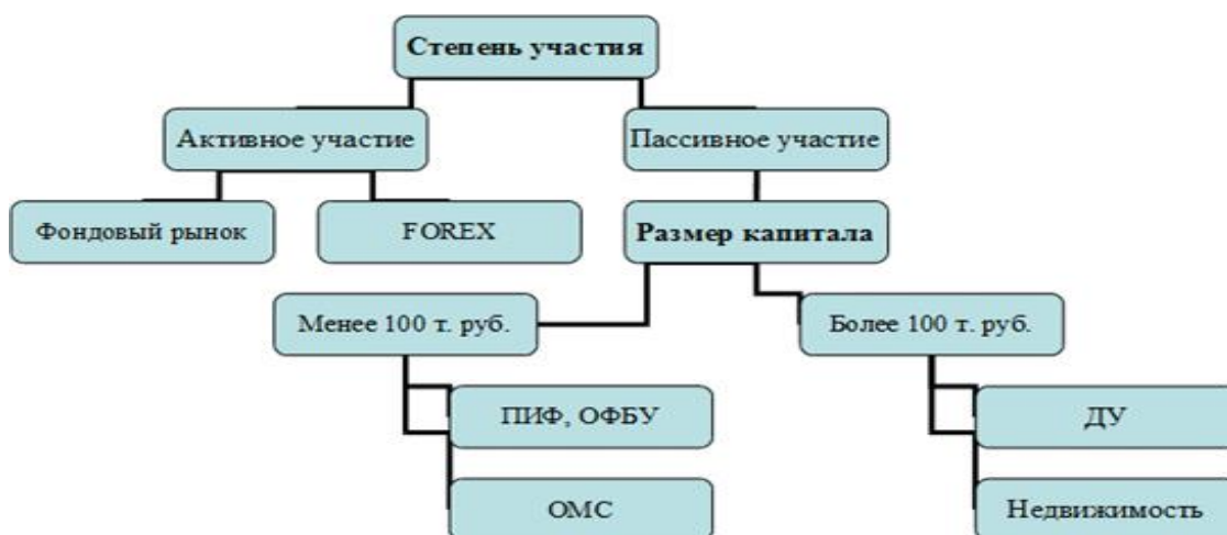
Рисунок 2. Степень участия

9) Криптовалюта — относительно новый и высокорисковый способ вложений, но при должном умении можно неплохо заработать, особенно в период очередного роста. Можно вкладывать на этапе ICO, можно вкладываться в облачный майнинг, можно просто спекулировать на популярных биржах криптовалют.