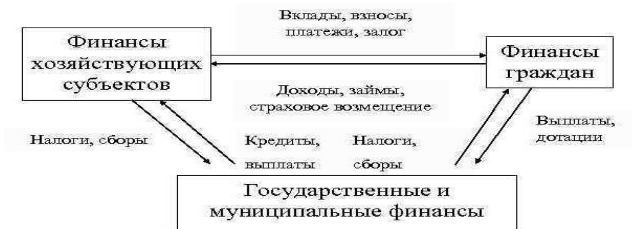
Рисунок 5. Взаимосвязь основных звеньев финансовой системы

Взаимосвязь основных звеньев финансовой системы Финансы организаций Финансы граждан Государственные и муниципальные финансы Вклады, взносы, платежи, залог Доходы, займы, страховое возмещение Кредиты, выплаты Налоги, сборы Налоги, сборы Выплаты, дотации Органы защиты прав потребителя финансовых услуг: