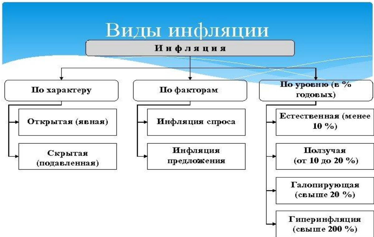
Рисунок 3. Виды инфляции

Виды инфляции Денежная реформа (проводиться однократно) – полное или частичное преобразование денежной системы, проводимое государством с целью упорядочения и укрепления денежного обращения.